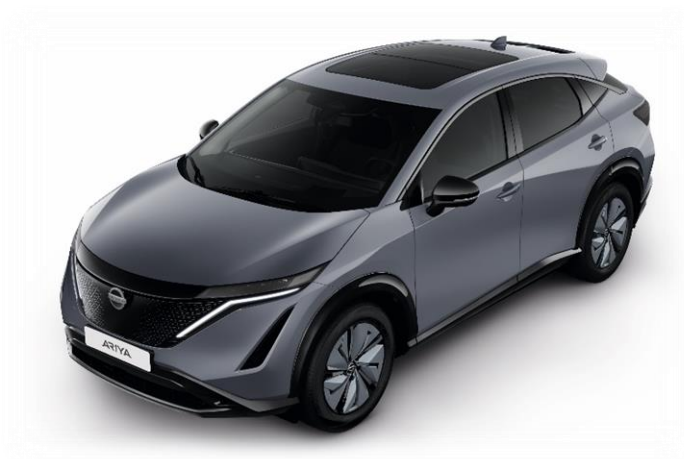
Szary ceramiczny [KBY]

Lakier metalizowany / perłowy (jednokolorowe nadwozie) – BEZ DOPEŁATY