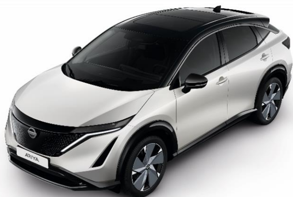
Biały perłowy + czarny dach i lusterka [XGA]

Lakier metalizowany / perłowy + dach i lusterka w kolorze czarnym – dopłata: 5 000 zł 1