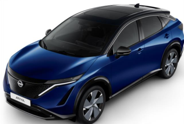
Niebieski perłowy + czarny dach i lusterka [XGU]