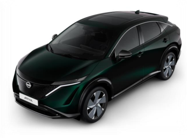
Zielony perłowy AURORA [DAP]