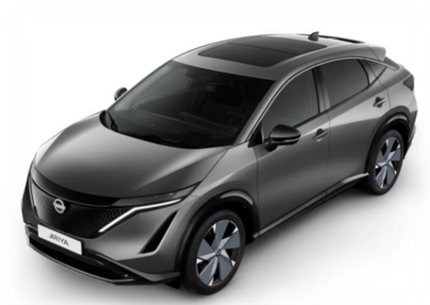
Szary metalizowany [KAD]