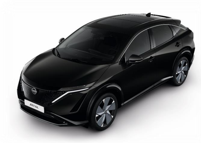
Czarny perłowy [GAT]