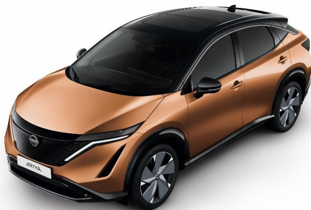
Miedzian Akatsuki + czarny dach i lusterka [XGJ]