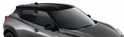
XEX SZARY CERAMICZNY + CZARNY DACH