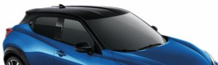
XGZ NIEBIESKI + CZARNY DACH