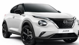
QBE BIAŁY PERŁOWY | 3 000 zł