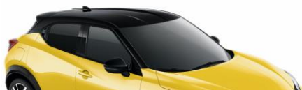
YAS ŻÓŁTY „ICONIC” + CZARNY DACH