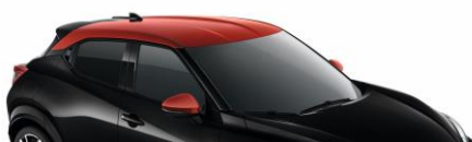
YAX CZARNY PERŁOWY + CZERWONY DACH „FUJI SUNSET”