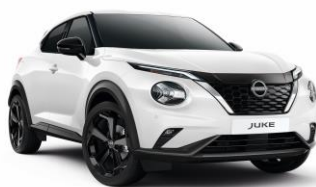
326 BIAŁY | 1 500 zł