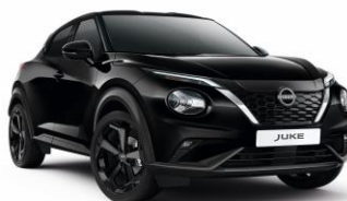
GAT CZARNY PERŁOWY | 3 000 zł