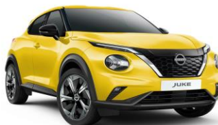
ECE ŻÓŁTY „ICONIC” | 3 000 zł