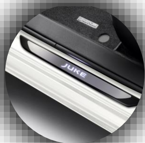
Podświetlane nakładki progów