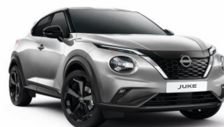
KYO SREBRNY | 3 000 zł