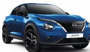
RCF NIEBIESKI | 3 000 zł