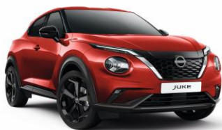
Z10 CZERWONY | Bez dopłaty