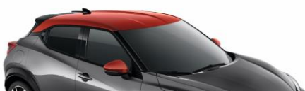
XFB SZARY + CZERWONY DACH „FUJI SUNSET”

*Wersja N-Sport dostępna w lakierach YAV, XKJ, XEX, GAQ, YAS Wersja N-Design dostępna w lakierach GAQ, XDQ, XEX, XGZ, XKJ, YAS, YAU, YAX, YAY