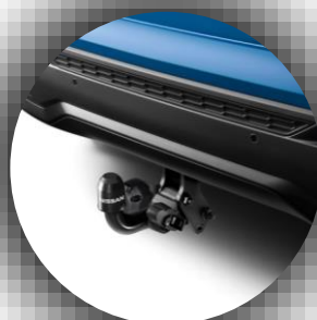
Hak holowniczy zdejmowany