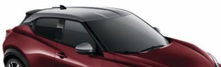
XEE BURGUNDOWY + SREBRNY DACH