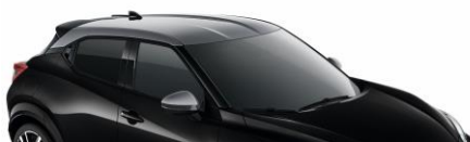
YAY CZARNY PERŁOWY + SREBRNY DACH