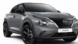
KBY SZARY CERAMICZNY | 3 000 zł