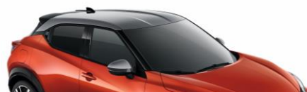
XEZ CZERWONY „FUJI SUNSET” + SREBRNY DACH