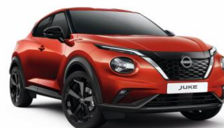
NBV CZERWONY „FUJI SUNSET” | 3 000 zł