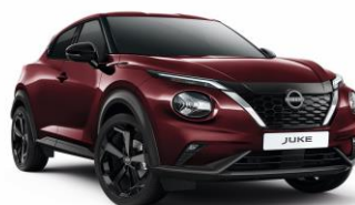
NBQ BURGUNDOWY | 3 000 zł