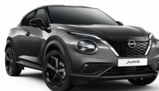
KAD SZARY | 3 000 zł