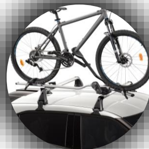
Uchwyt mocowania roweru stalowy